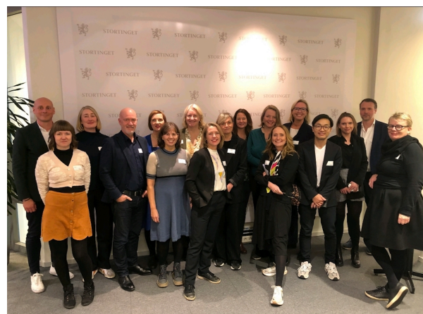
Sammen er vi sterke: NBU og nesten hele litteraturfeltet samlet under innspill til statsbudsjettet 2024.