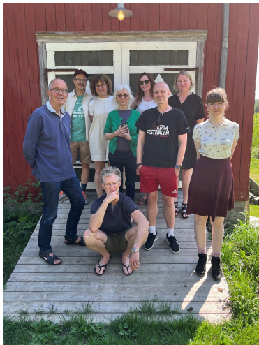
Motiverte deltakere på NBUs skrivesamling

Det arrangeres fagdager for medlemmene i forbindelse med medlemsmøte og årsmøte (les mer på s. 8 og 9). NBU gir også medlemmer mulighet til å delta på seminarer og kurs i inn- og utland.