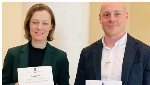
Daværende kulturminister Anette Trettebergstuen og NBUs leder med Prop. 82 L.

Viktig arbeid med ny boklov. Fastpris og strømming av lydbøker er fokusområder for NBU.