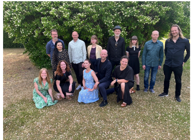
NBUs styre og råd poserer i pausen på seminar.