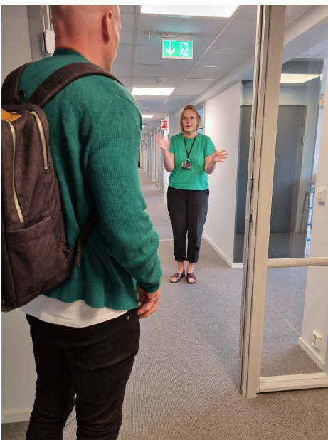
Godt samspill i NBUs korridorer. Leder og administrasjonsleder med matchende antrekk.