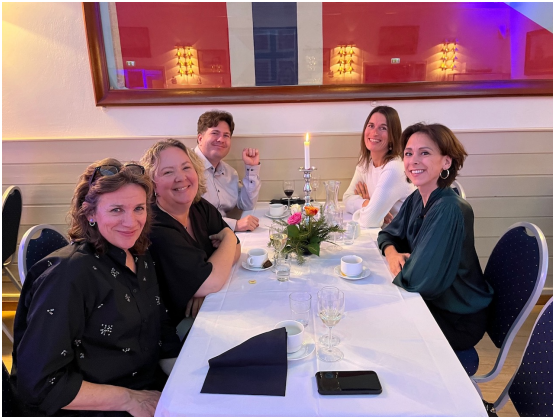
Blide deltakere på NBUs medlemsmøte i Sjømannsforeningens lokaler.