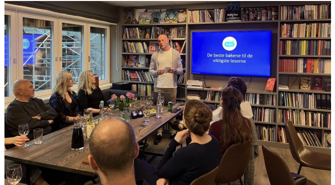
Lydhøre barne- og ungdomsbokforfattere på NBUs debutanttreff.